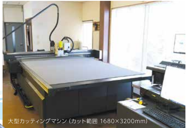
大型カッティングマシン (カット範囲 1680×3200mm)