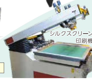
シルクスクリーン 印刷機