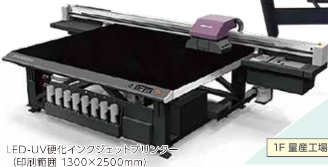
LED-UV硬化インクジェットプリンター (印刷範囲 1300×2500mm)