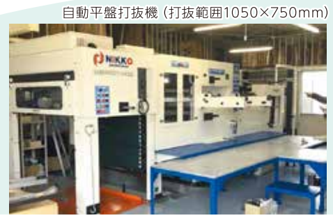
自動平盤打抜機 (打抜範囲1050×750mm)